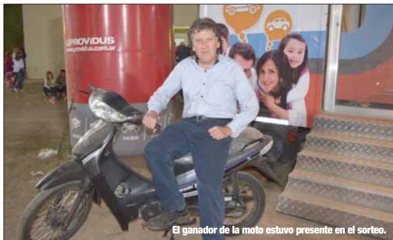
El ganador de la moto estuvo presente en el sorteo.

Pero además se organizó en forma paralela un auténtico festival de nivel nacional. En la jornada inaugural, Los Tekis deslumbraron al público con música y alegría. La noche siguiente, los Auténticos Decadentes le pusieron color y fiesta a la Expo, mientras que el sábado fue el turno del folclore junto a Peteco Carabajal y el Dúo Coplanacu.